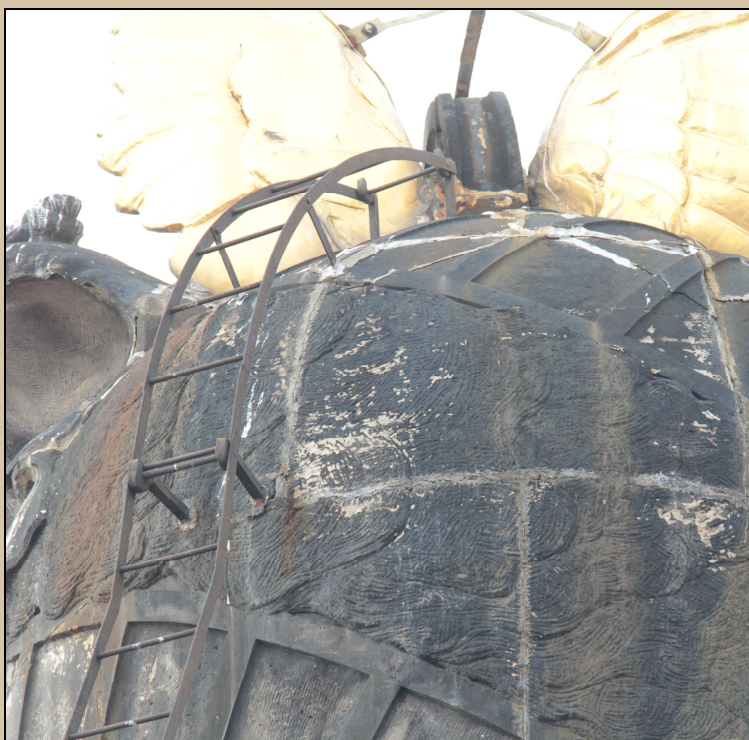
pohled horní část žebříku